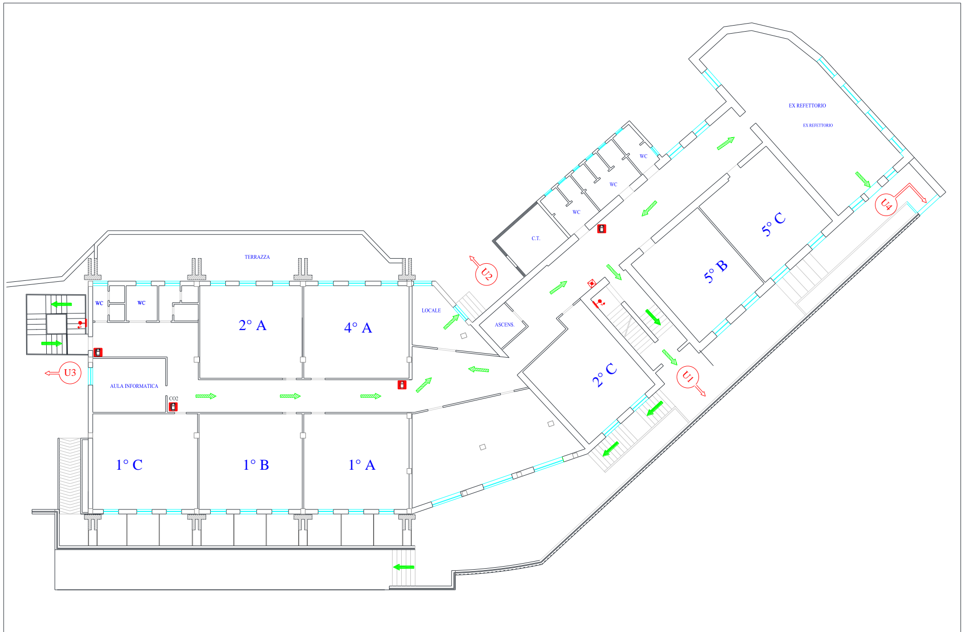
Figura 1. Piano Primo Scuola Primaria "Bruno Ciari" - Chiusiana