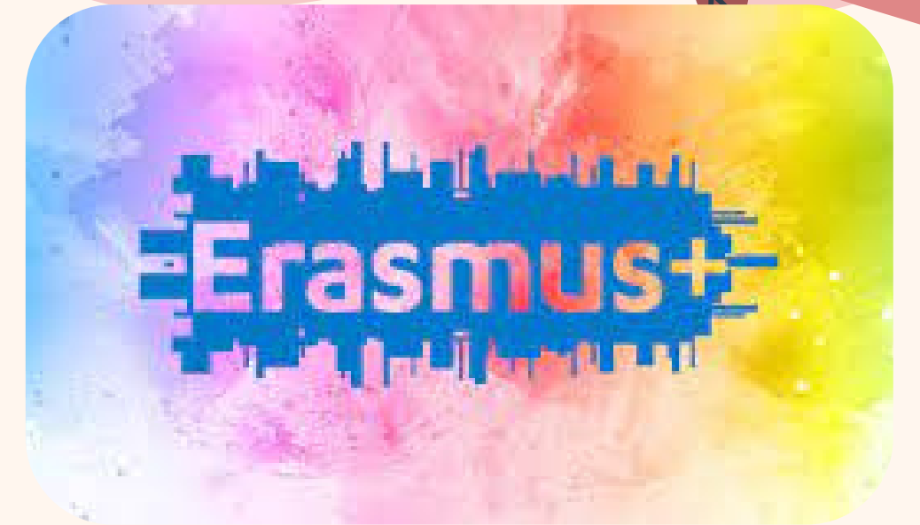
AVVICINAMENTO ALLA PIATTAFORMA ETWINNING E ERASMUS+

PERCORSI DI PREPARAZIONE ALLA CERTIFICAZIONE LINGUISTICA