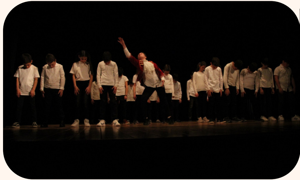
TEATRO IN LINGUA INGLESE

Il percorso, dal carattere inclusivo e con una forte impostazione comunicativa, si realizza attraverso una varietà di proposte: